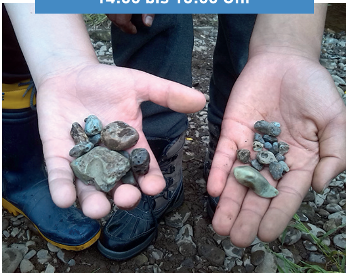
Auf der Suche nach dem Aggergold

Dienstag, 16. Juli 2024 14:00 bis 16:00 Uhr